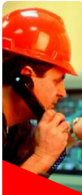
Facultad de Ingenierías