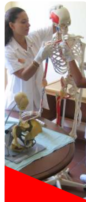
Facultad de Ciencias de la Salud