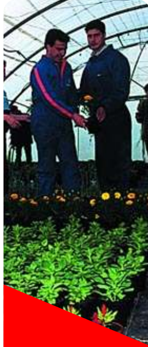
Facultad de Ciencias Agrarias y del Ambiente