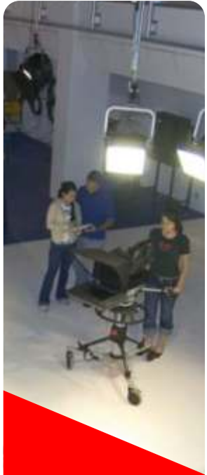
Facultad de Educación, Artes y Humanidades

Oficina de Admisiones y Registro Universidad Francisco de Paula Santander Av. Gran Colombia No. 12E-96 B. Colsag - Torre Administrativa 1er piso e-mail: admiregl@motilon.ufps.edu.co Teléfonos: 5776655 - 5751563 Cúcuta, Norte de Santander - Colombia