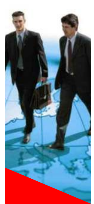
Facultad de Ciencias Empresariales